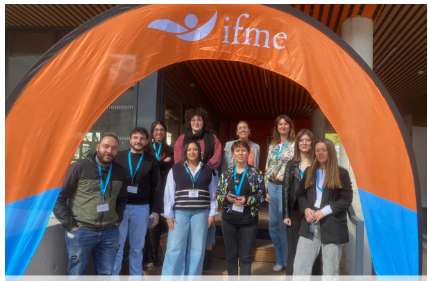
Stand de présentation des formations de l'IFME à l'Université Vauban.