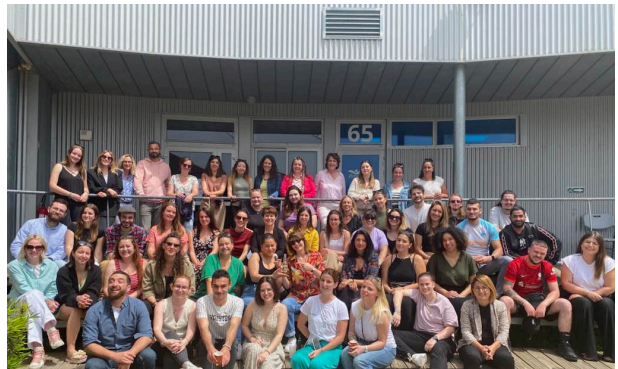
Dernier jour pour la promo des ES3.