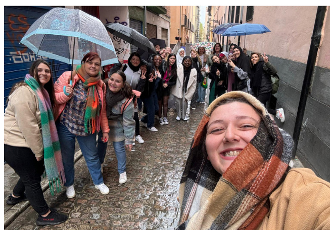
Les étudiants de la promo ASS2 et leurs formateurs.