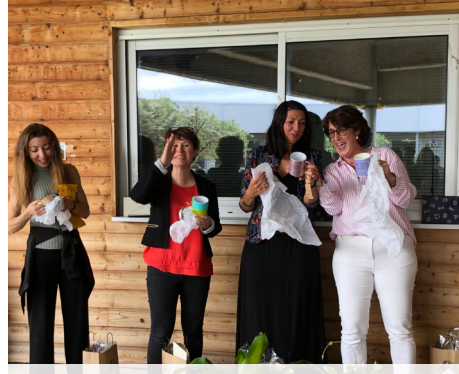
L'équipe pédagogique des ES remerciée par la promo sortante.