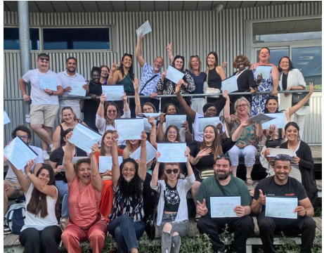
Dernière promo diplômée de la filière AES en 2024.