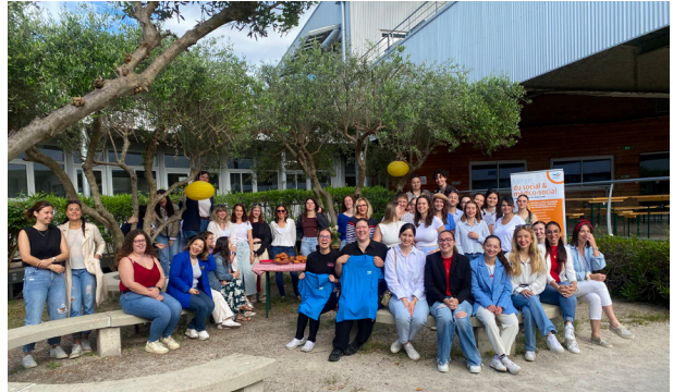
Repas partagé entre les étudiants EJE de l'IFME et 2 stagiaires EJE québécoises en mobilité internationale.