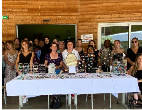
Vente de bijoux organisée par les AS2 pour financer leur voyage d'études à Grenoble.