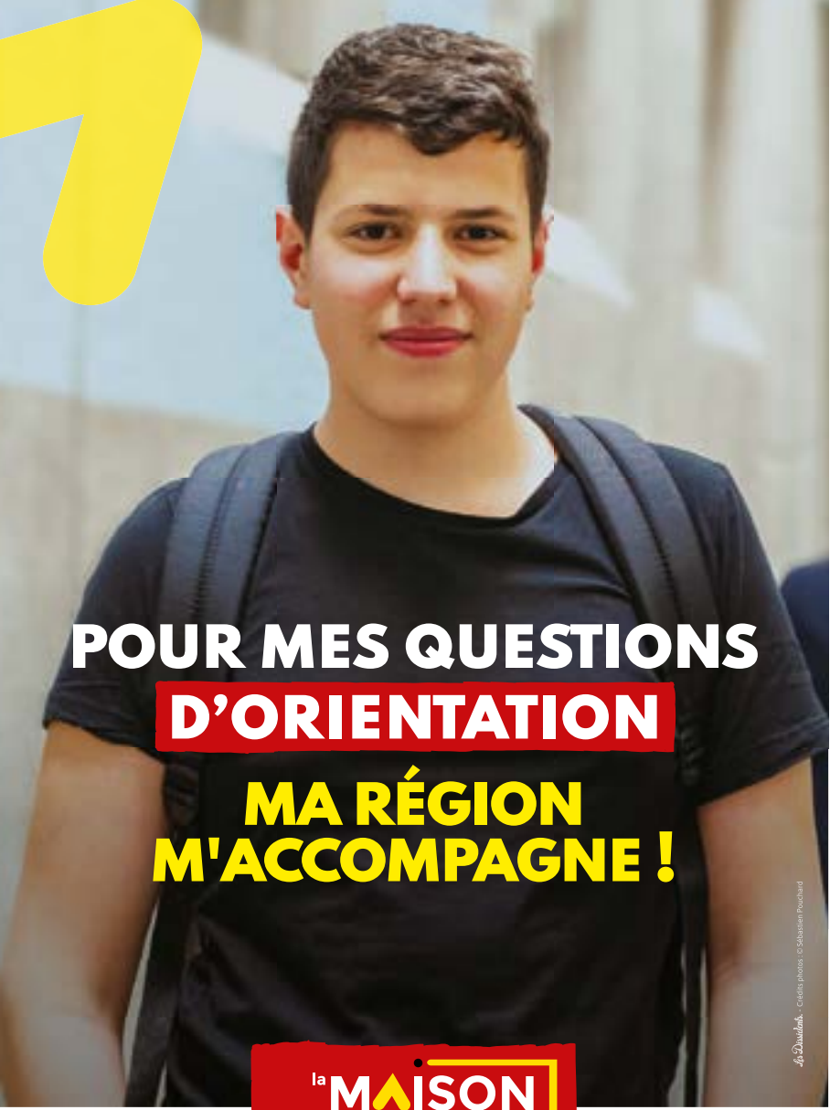
J. Duval - Crea photo - Sébastien Pouchard